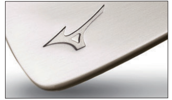
④ダブルニッケルメッキ・サテン仕上げ