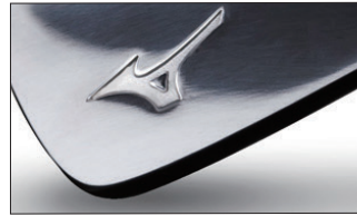
⑦黒染め艶有り(メッキはされておられません)