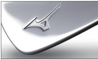
⑤ノンメッキ艶有り