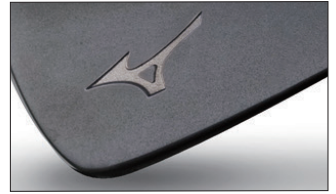
⑧黒染め艶無し(メッキはされておられません)