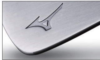
⑥ノンメッキ艶無し