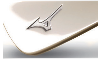
③ダブルニッケルメッキ・ブライツ仕上げ