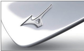
①ニッケルクロムメッキ・ミラー仕上げ

◎アンダーカットキャビティ採用モデルのキャビティ内はシルバー塗装になります。ただし、③、④はシャンパンゴールド塗装になります。※モデルにより制限があります。