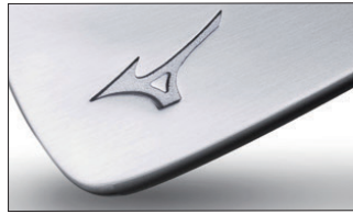
②ニッケルクロムメッキ・サテン仕上げ