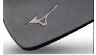
⑧黒染め艶無し(メッキはされておりません)