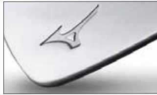
②ニッケルクロムメッキ・サテン仕上げ