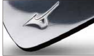
⑦黒染め艶有り(メッキはされておりません)