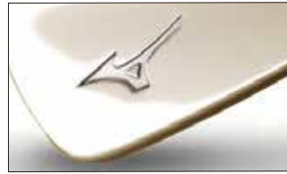
③ダブルニッケルメッキ・ブライツ仕上げ