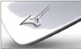
①ニッケルクロムメッキ・ミラー仕上げ

◎アンダーカットキャビティ採用モデルのキャビティ内はシルバー塗装になります。ただし、 ③ 、 ④ はシャンパンゴールド塗装になります。※モデルにより制限があります。