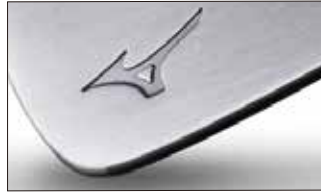
⑥ノンメッキ艶無し