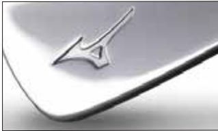
⑤ノンメッキ艶有り